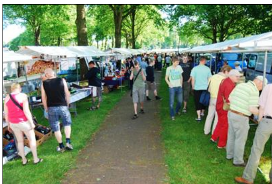
Plaatje van de markt, Gemoedelijke sfeer, meer dan 1500 bezoekers en minimaal 100 standhouders