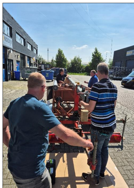
Om te begrijpen hoe het allemaal werkt heeft wel wat overleg gekost. (gelukkig was het mooi weer)

De achterste stempel schoof ook niet echt lekker, eigenlijk schoof hij niet, je had er een flinke hamer bij nodig om er beweging in te krijgen. Het bleek dat hij klemde op de vulplaatjes tussen de twee koker profielen, dit hebben we met behulp van een slijptol en een lik vet op kunnen lossen.