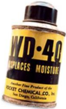
Eerste spuitbus uit 1958

De eerste spuitbussen werden al verkocht in 1958 en in twee jaar tijd verdubbelde de omzet. In 1959 werd de naam van Rocket Chemical Company wegens succes veranderd in 'WD-40 company'. WD-40 was toen nog hun enige product.