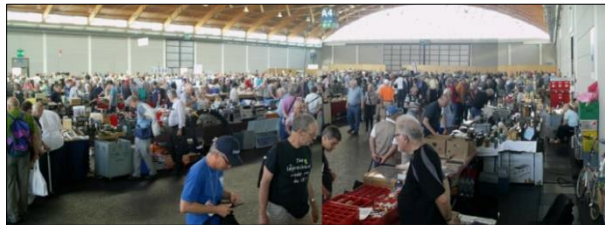
Sfeerbeeld van één van de drie hallen in 2023

Naast het tentoonstellen en verkopen van apparatuur en accessoires, legt deze beurs ook een sterke nadruk op het promoten van opkomend talent en het bevorderen van wereldwijde netwerken onder radioamateurs. De bezoekers van de beurs zijn amateurradioliefhebbers van over de hele wereld, waaronder ook jongeren, die via speciale evenementen en wedstrijden kennis maken met het onderwerp amateurradio.