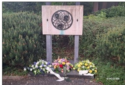
Het monument voor gevallen radioamateurs op het terrein van KPN aan de Witte Kruislaan in Hilversum