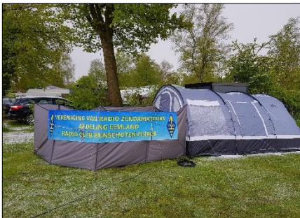
Onze tent net na die flinke hagelbui