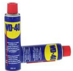
Eén van de vele modellen spuitbussen die we tegenwoordig overal tegen komen.

Je kunt er dus een ei in bakken maar je moet het niet opeten want de olie is giftig bij inwendig gebruik. Het actieve ingrediënt is een niet vervliegende olie die op het oppervlak achterblijft. Deze smeert en beschermt. De olie is ook nog eens verdund met een koolwaterstof die kleine ruimtes penetreert, daarna verdampt en de olie achterlaat.