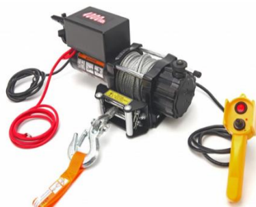
De door ons gekozen 12 Volt 1100 Watt lier, goed voor een trekkracht van 1800kg.

Toen was de elektrische lier aan de beurt, we hadden al eerder besloten dat we de oude zouden vervangen omdat die wel erg snel draaide wat naar ons idee tot gevaarlijke situaties kan leiden. We hebben een nieuwe 12 Volt lier aangeschaft met een vermogen van 1100 Watt die maximaal 1800 kg. kan trekken, meer dan voldoende voor ons doel. Deze lier doet zijn werk in een rustiger tempo, wat naar ons idee veiliger is. Voor de spanningsverzorging staat in één van de kasten op de mastaanhanger een 90Ah. accu. De 12 Volt lier in combinatie met de accu maakt het ons mogelijk om als het nodig is zonder 230 Volt te kunnen werken.