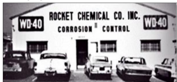
Het begon in 1953 in een fabriek in San Diego, Californië

Het begon in 1953 in een fabriek in San Diego, Californië. Die fabriek droeg de naam Rocket Chemical Company. Zij maakte chemische componenten voor de raketindustrie. De drie stafleden van de Rocket Chemical Company werkten aan een oplossing die roest zou tegengaan en materialen zou ontvetten ten behoeve van de Convair rakettenfabriek die werkte aan de Atlasraket. Nog niet die raketten de ruimte in geschoten zouden worden, maar die gebouwd