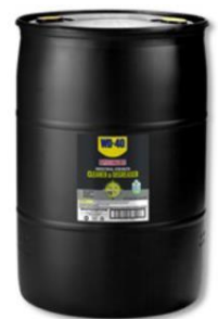
Zelfs verkrijgbaar in drums van 55ltr.

Het bedrijf is na zestig jaar zo groot geworden dat het beursgenoteerd is en wereldwijd zijn producten aanbiedt. Je kan inmiddels een heel assortiment van WD-40 kopen. Van de oude traditionele WD-40 tot snijolie, kettingvet en contactspray, het wordt allemaal geleverd. Het bedrijf heeft tegenwoordig in veel landen een eigen vestiging. In Nederland is het te koop bij de bouwmarkt, en zelfs bij een drogisterijketen. Je kunt het krijgen in spuitbussen, in kannen van 5 liter en zelfs in drums van 55 liter.